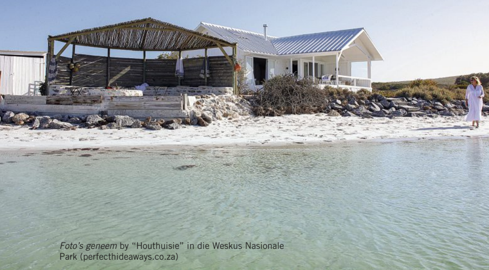
Foto's geneem by "Houthuisie" in die Weskus Nasionale Park